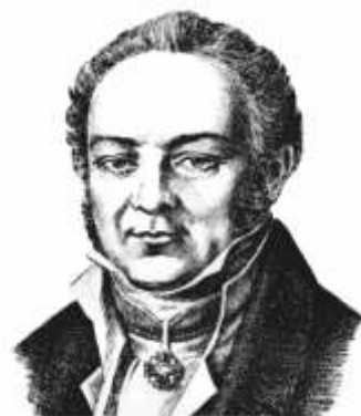
Карл Федорович Фукс

Ученик К. Ф. Фукса, Н.А. Скандовский стал первым русским клиницистом-терапевтом в Казанском университете, при нем открылось знаменитое здание Университетской клиники (1840 г.). Именно здесь зародились знаменитые казанские клинические школы. Каждое утро, приходя в клинику, он давал клинические наставления студентам на латинском языке ( lingua latina loqui ).