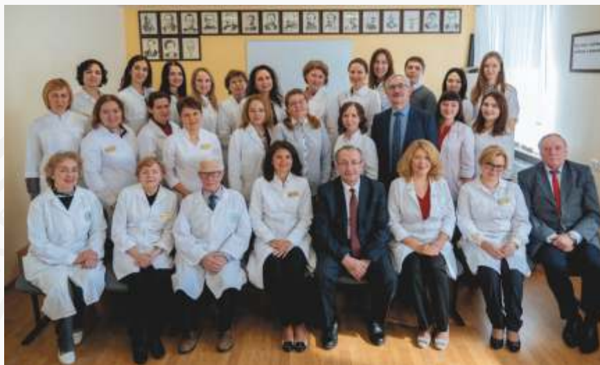
Коллектив кафедры госпитальной терапии, 2019

На кафедре сохраняется преемственность передачи медицинских знаний, клинического опыта, и накопленной в течение 205-летнего пути мудрости врачевания. Приходит молодежь, развиваются современные научные направления.