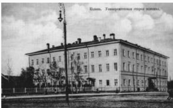
Университетская клиника, в настоящее время перекресток ул. Кремлевская и ул. проф. Нужина.